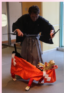
麒麟獅子マリオネット